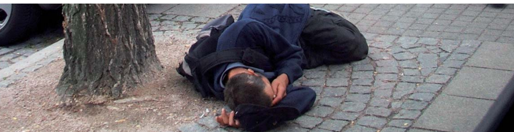
Verarmung ist ein Prozess, in dem die soziale Ausgrenzung eine Begleiterscheinung ist, für die wir alle Verantwortung tragen

Aber Armut und Arbeitslosigkeit haben nicht nur globalpolitische, sondern auch individuelle, soziokulturelle Gründe. Zu nennen wären etwa: niedriges Bildungsniveau, mangelnde Lesekompetenz, mangelnde Hochschulreife, mangelndes Selbstvertrauen, mangelnde Antriebskraft. Solche Ursachen erklären nicht alle Fälle von Armut und Arbeitslosigkeit, aber doch viele Einzelfälle. Um die durchaus vorhandenen offenen Stellen zu besetzen, bedarf es einer sehr viel größeren Zahl gut ausgebildeter, höher qualifizierter Fachkräfte, die wir momentan nicht haben und auf absehbare Zeit auch nicht bekommen werden, weil die dafür notwendigen Voraussetzungen – wie Bil-